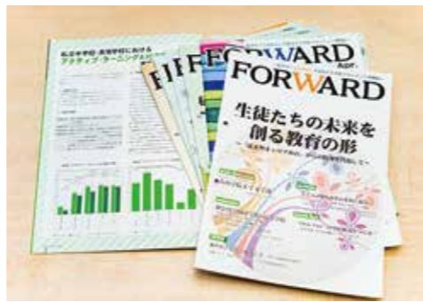
東西の国会図書館にも納品中

私学が直面する課題やニーズに対応したテーマを設定し、学校経営に役立つ情報を厳選してお届けします。また、会員校同士の情報交換の場を提供しています。